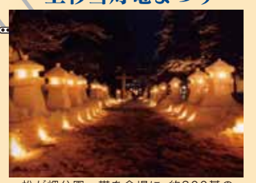
松が岬公園一帯を会場に、約300基の雪灯籠、3,000個の雪ほんほりに燭が灯される幻想的な冬まつり。