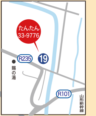
上杉雪灯籠まつり

上杉、松平両神社の春の大祭で、絢爛豪華な上杉行列や戦国史上最大の戦いと称される上杉と武田の川中島合戦を再現。